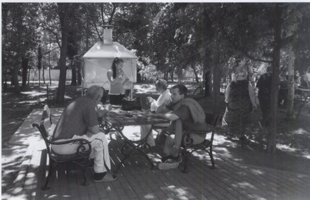
2017- г Бачки Петровац

Након завршене посете захваљујући љубазности кустоса имали смо срећу и задовољство да начинимо заједничку фотографију са познатим глумцима Дејаном Луткићем и Горданом Кичићем који су снимали серију „Јагодићи“. Наше дружење, по прелепом сунчаном дану, смо наставили обиласком аквапарка „Петроленд“ у Бачком Петровцу. Да бисмо предахнули, средили утиске и разменили информације отишли смо на ручак у етно ресторан, где су послужени војвођанским, петровачким специјалитетима.