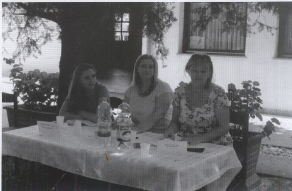
Детаљи са сусрета 2018. г. и стручног скупа под називом „Кад невидљиви постану видљиви – сарадња ЦСР и установа за смештај душевно/ ментално оболелих лица“ у Бачком Петровцу